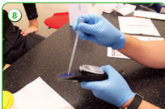
Проверка удельной плотности