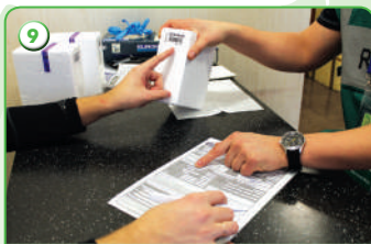
Заполнение протокола допинг-контроля и проверка внесенных данных