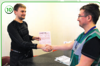
Окончание процедуры допинг-контроля